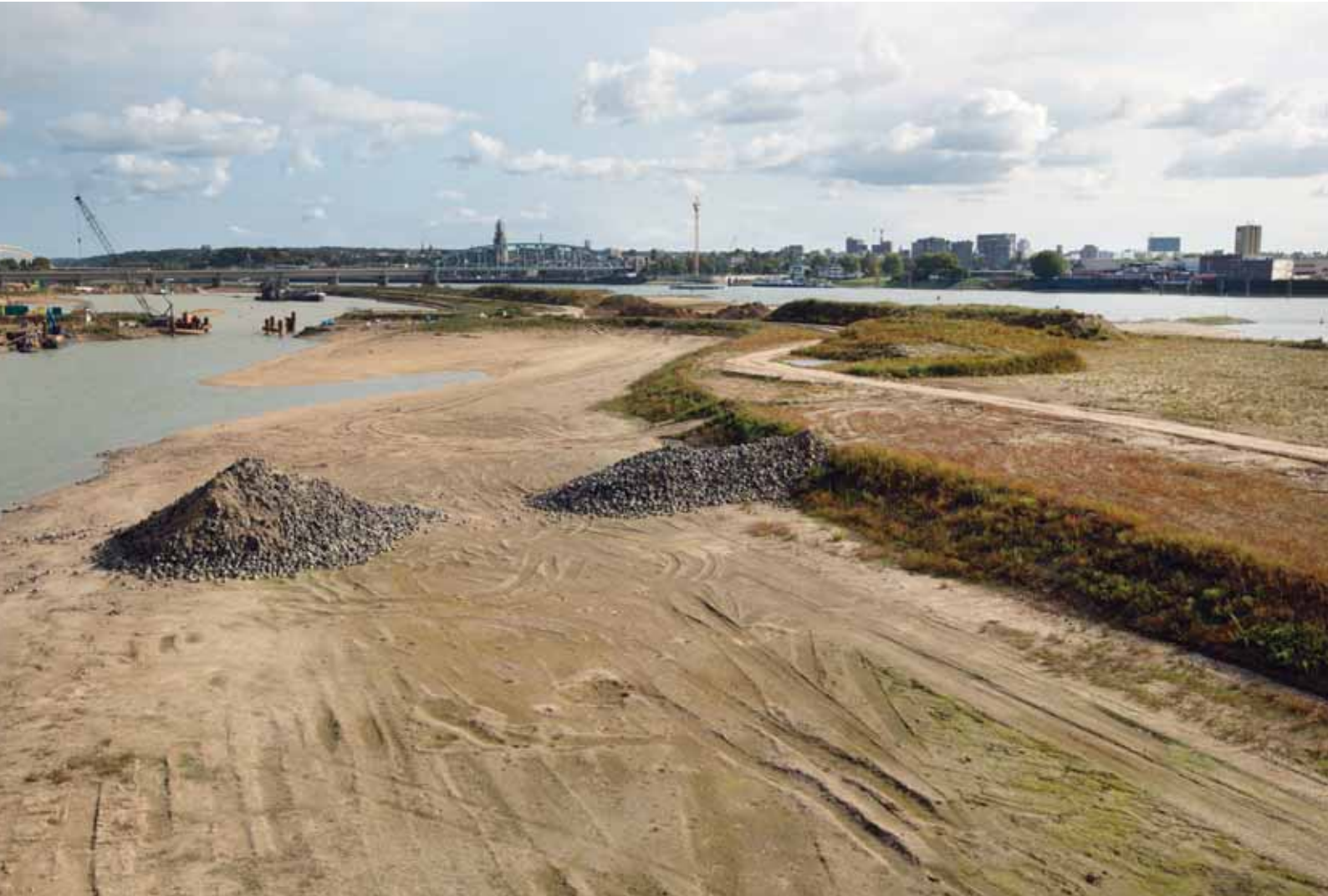
Nevengeul van de Waal bij Nijmegen.